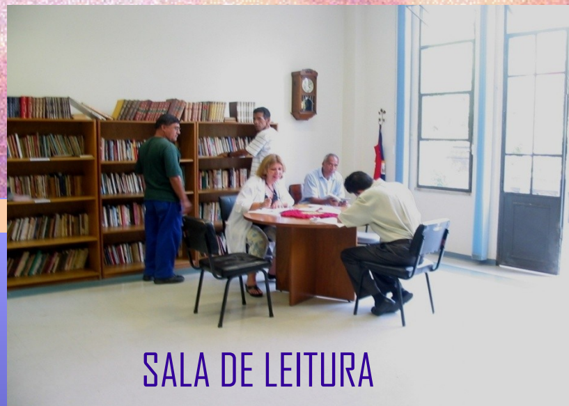
SALA DE LEITURA