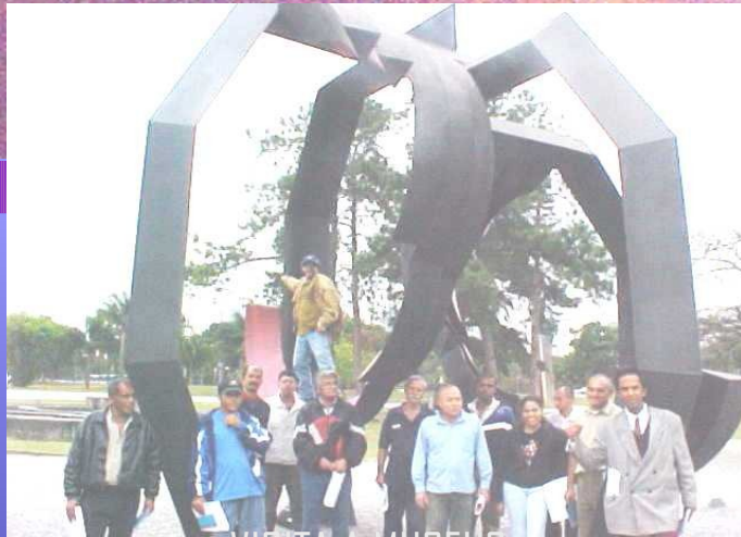
VISITA A MUSEUS