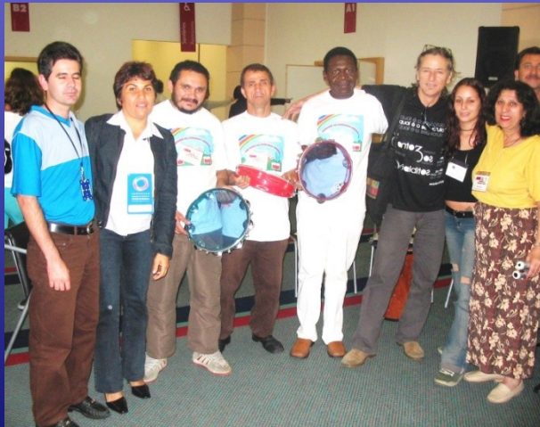
CONGRESSO DE CAPS 2004