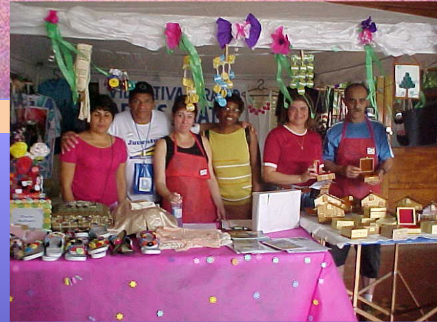
ANIVERSARIO DO BOM RETIRO