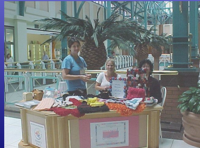
BALCÃO DA CIDADANIA